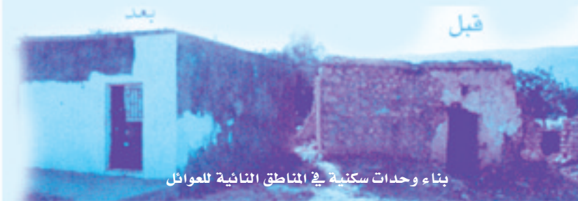
بناء وحدات سكنية في المناطق النائية للعوائل

كما وكان للجمعية دور فعال ومشهود خلال عدوان تموز ٩٣ ونيسان ٩٦ الصهيونيين وخلال بعض النكبات من جراء السيول والثلوج والحروب، حيث وزعت مساعدات طارئة وفورية وضمن برامج مدرسة على أكثر من