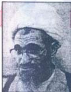
آية الله مشكيني