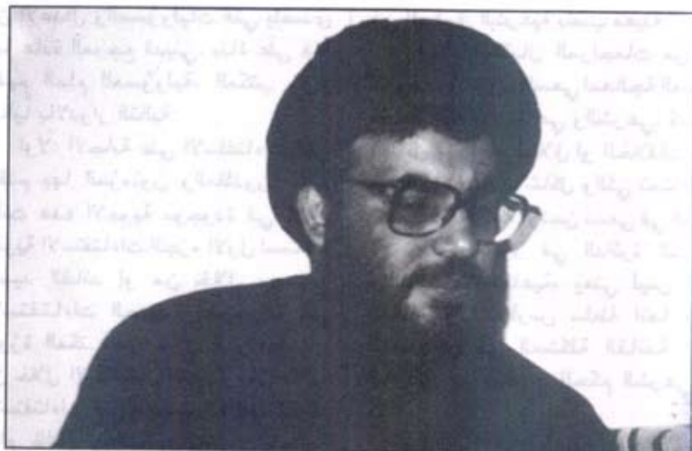
سماعة السيد نصر الله متحدثاً لبقية الله

لادارة الامور الدينية في منطقتي البقاع والشمال، وايضاً شرفني بهذا التكليف في بيروت وجبل عامل. بهذا العنوان وبهذه الصفة نحن معنيون بأن نقوم وتتصدى للشؤون التي تعني هذا الجانب، يعني شؤون المرجعية وشؤون المقلدين. بحسب ما جاء في الوكالة هناك الاجازة في الامور الحسينية وقبض الاموال الشرعية والتصرف فيها بحسب الاصول والضوابط الشرعية وادارة الامور الدينية، بالطبع عندما نتحدث عن الامور الدينية فإن المجال يتسع للكثير