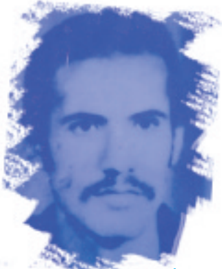
أمراء الجنة ص٢٨