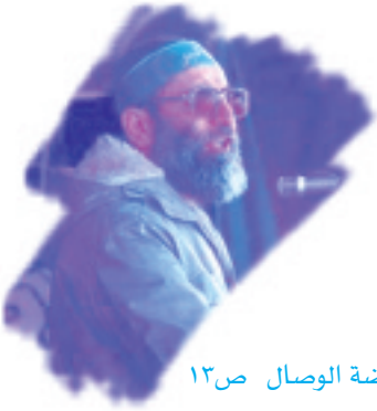
روضة الوصال ص١٣