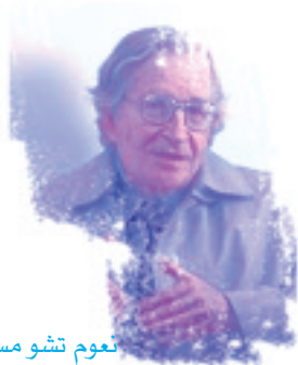
تعوم تشومسكي ص٧٩