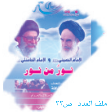
ملف العدد ص٢٣