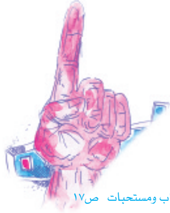
آداب ومستحبات ص١٧