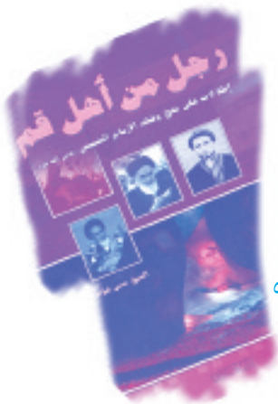
قراءة في كتاب ص٥٢