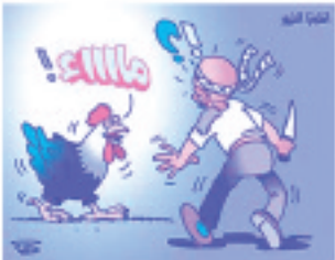
الصحة والحياة: ص ٩٠