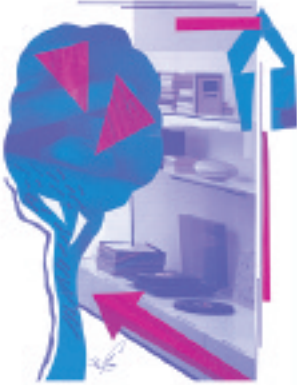
قضايا معاصرة: ص ٦٦