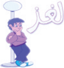
أسرة وطفل: ص ٧٦