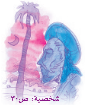
شخصية: ص ٣٠