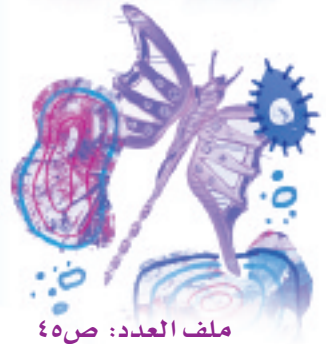
ملف العدد: ص ٤٥