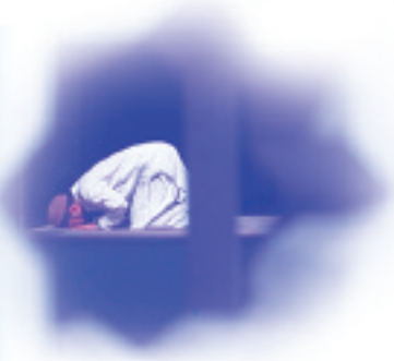
مع القائد: ص ١٠