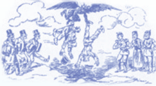
ابليس يحمل أعداء مصر إلى الجحيم - يعقوب صنوع ١٨٩٦